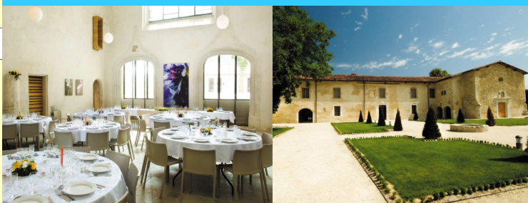
Le Couvent des Carmes, à visiter et à déguster...