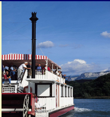
Bateau à Roue Royans Vercors